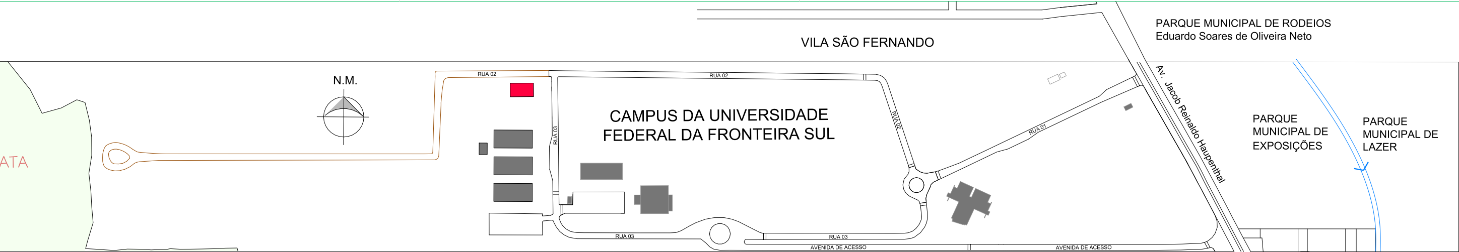
PLANTA DE SITUAÇÃO ESC: 1/5000